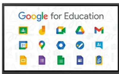
MIRAI TOUCH ChromeOS Flex 搭載モデル