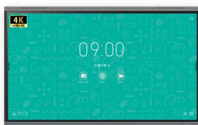
MIRAI TOUCH 最新モデル 3Xシリーズ